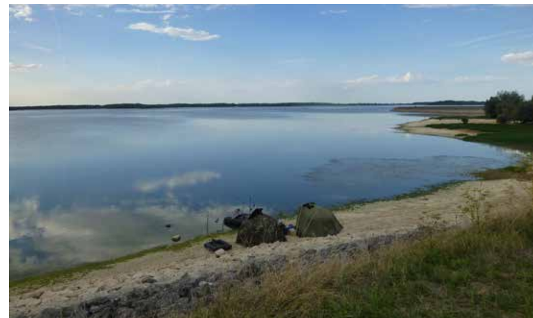
Les eaux du lac d'Orient aux couleurs perpétuellement changeantes.

Maintenant, il n'y a plus qu'à trouver la bonne piste cyclable qui va nous conduire au départ de la Voie verte. Mais voilà, ce n'est pas gagné parmi les nombreuses pistes qui parcourent la ville. Nous voici enfin à la sortie de Saint-Julien-les-Villas, sur la D49, en direction de Verrières, à l'intersection de la Voie verte du canal de la Haute-Seine et de