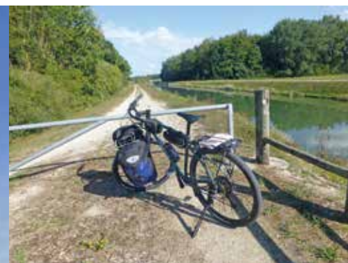
Le canal Saint-Julien, canal de restitution, départ de la Voie verte.

Distance : 107 km Arrivée-Départ : Troyes Renseignements : www.aube-champagne.com