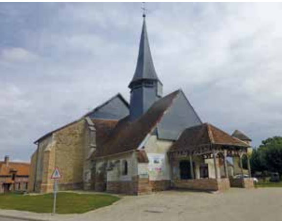
L'église de Géraudot.w