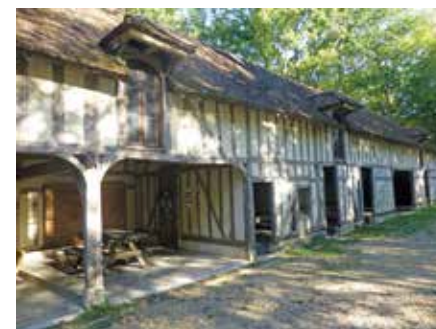
La grange de la maison du Parc naturel régional, une construction à pans de bois.