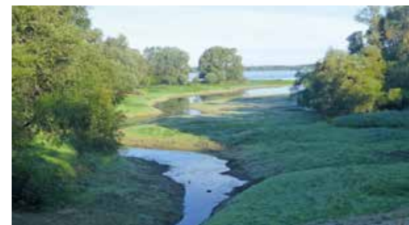
Une oasis verte et bleue.

la Voie verte des Grands lacs Seine et Aube. Elle démarre à la sortie du pont enjambant le canal Saint-Julien qui s'appellera plus loin canal de Morge. Nous allons le suivre jusqu'à Lusigny-sur-Barse et la prise d'eau au pied de la digue de la Morge qui retient les eaux du lac d'Orient. Il est temps de changer de braquet... Pas d'affolement, juste 300 m à 5 % ! Premier contact avec les eaux aux couleurs perpétuellement changeantes. De gros nuages lâchent une averse sur la rive opposée, les eaux passent par des nuances de vert, de bleu, de gris alors que tout à côté les nuages inoffensifs se reflètent dans les eaux bleues que rien ne vient troubler. Mesnil-Saint-Père offre l'occasion de faire étape ou même de prolonger son séjour et de s'offrir un programme de visites en étoile : du relief dans les vignes de la côte des Bar au nord, puis au sud, en forêt vers les Templiers et les Salamandres, en plaine vers les églises à pans de bois... Tous types d'hébergements sont possibles : hôtel, cottages, camping, hébergement de groupes, aire camping-car.