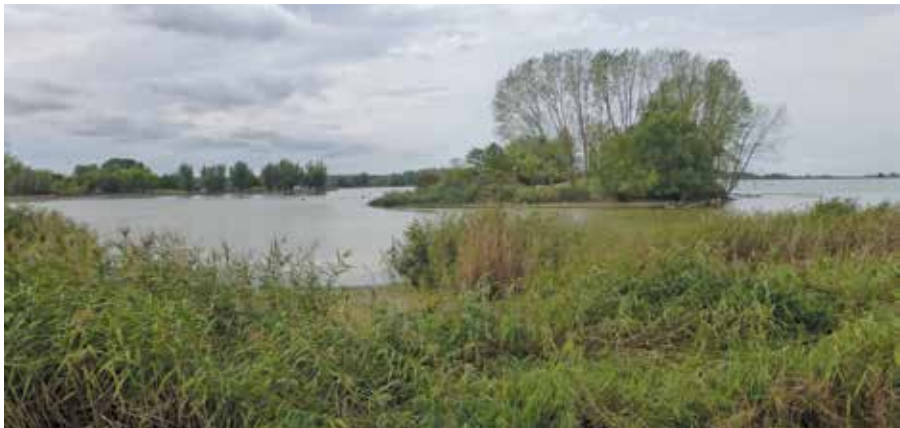
Îlot au bord du lac Amance.