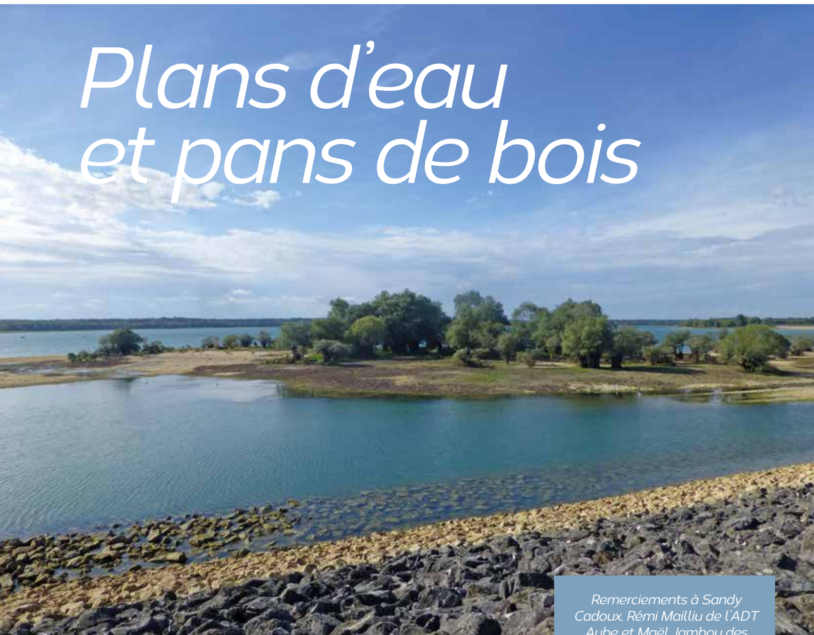
Le lac du Temple vu de la digue.