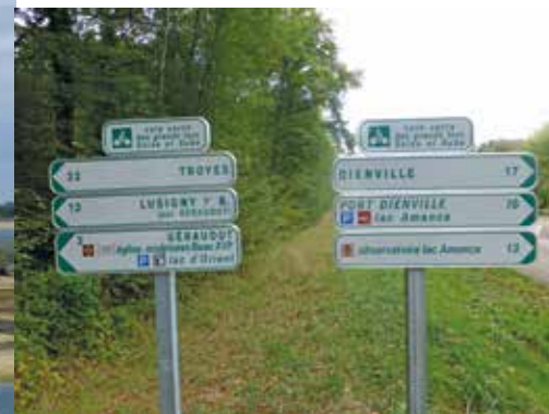
La signalisation est parfaite, il suffit d'être attentif.

Avant de nous élancer, petit retour dans l'histoire. Tout ça pour ça... pour que le zouave du pont de l'Alma n'ait pas les pieds dans l'eau lors des crues de la Seine qui peuvent être dévastatrices comme elles le furent en 1910 et 1951. Ainsi naquit l'idée de réaliser des lacs réservoir capables d'accumuler, en hiver, les eaux superflues de la Seine et ses affluents et les rendre au fleuve en été. Ces lacs réservoirs ont donc pour mission d'atténuer l'ampleur des inondations et de soutenir le débit du fleuve et ses affluents.