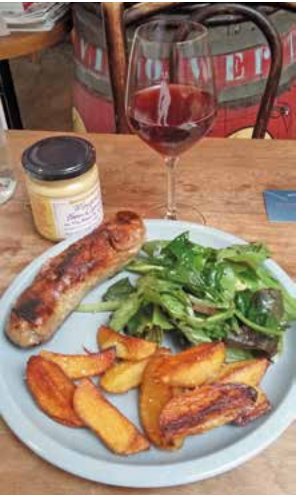
L'andouillette frites « Aux Crieurs de Vin » à Troyes.