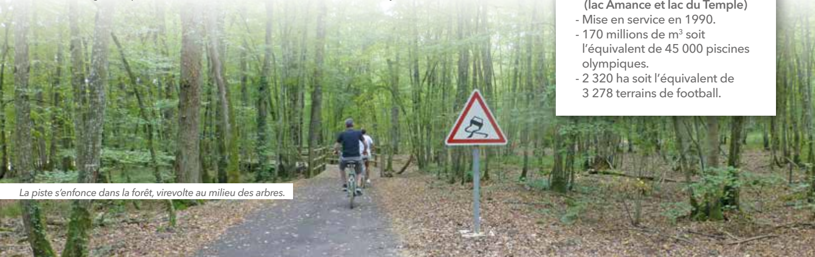
La piste s'enfonce dans la forêt, virevolte au milieu des arbres.